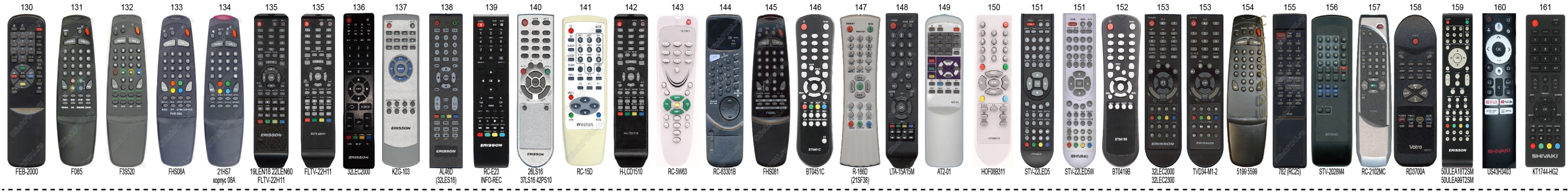
FEB-2000 F085 F3S20 FHS08A 21H57 копира 08A 19LEN18 Z2LEN60 FLTV-22H11 3ZLEC200 KZG-103 AL460 (3ZLES16) RC-E23 INFO-REC 26LS16 37LS16 42PS10 RC-150 HLED1510 RC-SW63 RC-63301B FHS081 BT0451C R-1680 (21SF30) LTA-15415M ATZ-01 HOF088311 STV-22LED5 STV-22LED9W BT04196 3ZLEC2000 3ZLEC2300 TVD34-M1-2 5199 5599 782 (RC25) STV-2028M4 RC-2102MC RC3700A 50ULEA18T2SM 50ULEA99T2SM US49K3403 KT1744-HG2