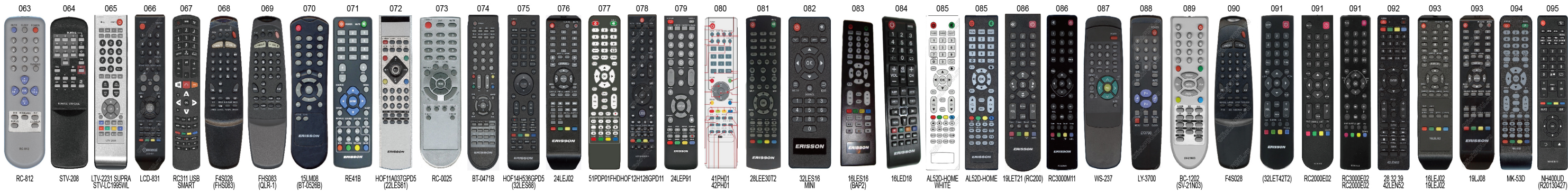
RC-812 STV-208 LTV-2231 SUPRA STVLC1965WL LCD-831 RC311 USB SMART F4S028 (FHS033) FHS083 (CLR-1) 15LM08 (BT-0526B) 15LM08 (BT-0526B) RE41B HOF11A037GPD5 (Z2LES81) RC-0025 BT-0471B HOF14H538GPD5 (3ZLES88) 24LEJ02 51PDP01FHDHOF12H126GPD11 24LEP91 41PH01 42PH01 28LEE3072 3ZLES16 MINI 18LES16 (BAP2) 18LED18 ALS2D-HOME WHITE ALS2D-HOME 19LET1 (RC200) RC3000M11 WS-237 LY-3700 RC-1202 (SV21N03) F4S028 (3ZLET4272) RC2000E02 RC3000E02 RC2000E02 28 32 39 42LEN62 16LEJ02 19LEJ02 19LJ08 MK-530 NH400UD (R20130427)